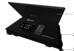
Рис. 2 Блок управления